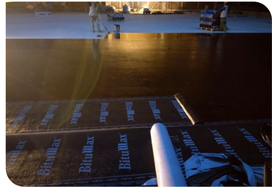
Thi công lăn lớp lót