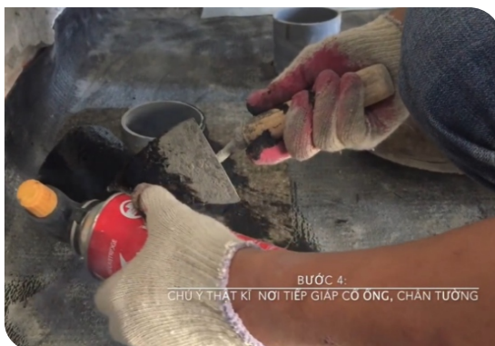
Xử lý cổ ống thoát nước