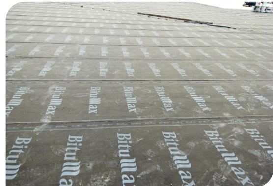
Bề mặt hoàn thiện