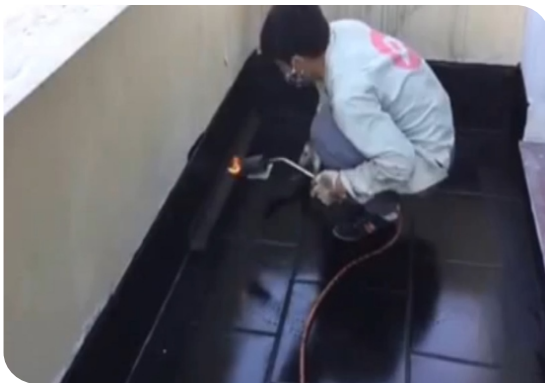
Xử lý góc chân tường