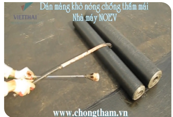
Cách khò tiêu chuẩn