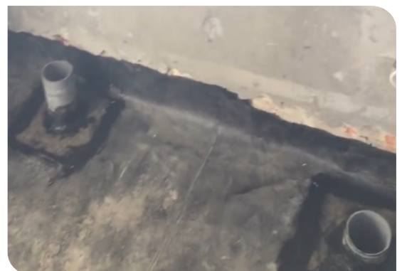
Hoàn thiện cổ ống và góc chân tường