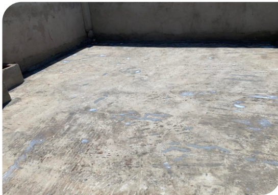
Chuẩn bị bề mặt