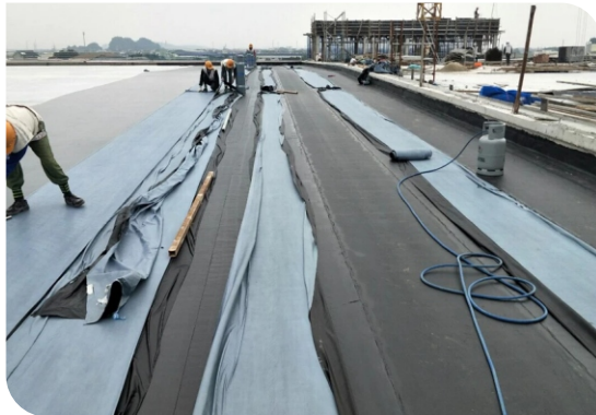
Thi công màng khô nóng