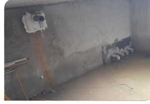
Thi công ghép cốt pha và đổ vữa Lemax Grout LM-G650