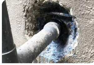
- Vệ sinh, quét thành trướng nở - Quét chất kết nối Revinox (pha với nước theo tỉ lệ 1:4)