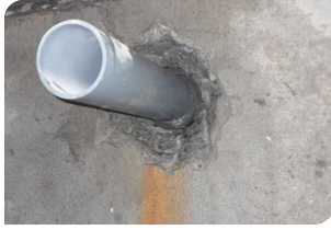
Đục vát quanh cổ ống