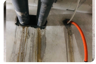
Trám và hoàn thiện bề mặt bằng vữa sửa chữa Neorep