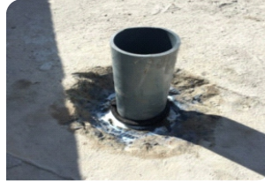
Vệ sinh cổ ống, quần thanh trường nở