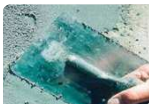
Trám và bề mặt bê tông bằng vữa sửa chữa Neorep