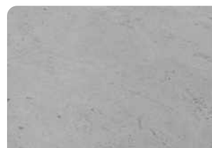
Bề mặt bê tông đạt