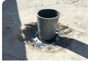
Vệ sinh cổ ống, quét thanh trướng nở