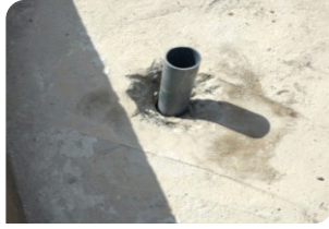
Đục vát quanh cổ ống, chèn xốp hoặc cấp pha bên dưới cổ ống