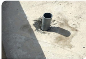
Đục vát quanh cổ ống, chèn xốp hoặc cốp pha bên dưới cổ ống