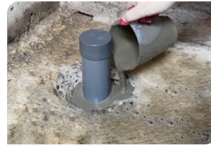
Thi công đổ vữa Lemax Grout LM-G650