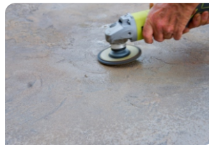
Sử dụng máy mài chà bề mặt bê tông