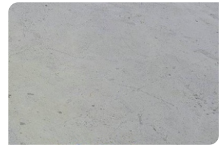
Bề mặt bê tông đạt