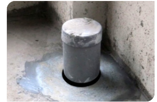
Bơm keo trám khe BS 8620S quanh cổ ống