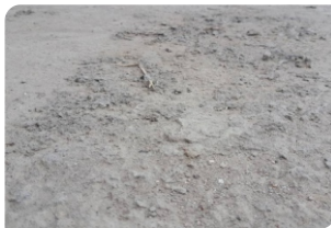
Bề mặt bê tông chưa đạt