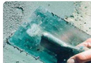
Trám vá bề mặt bê tông bằng vữa sửa chữa Neoprep