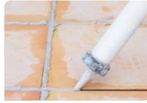
Trám vá mạch gạch bằng keo trám khe BS 8620S/ Jointex®