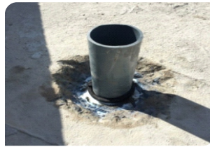
Vệ sinh cổ ống, quét thành trường nở