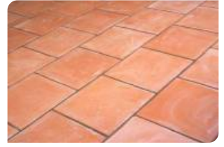
Bề mặt gạch đỏ đạt