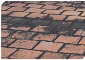
Bề mặt gạch đỏ chưa đạt