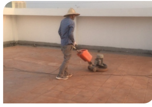
Sử dụng máy mài chà bề mặt gạch đỏ