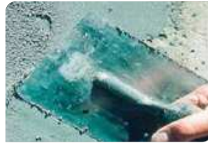
Trám vá bề mặt bê tông bằng vữa sửa chữa Neopre