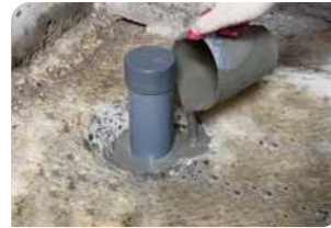
Thi công đổ vữa Lemax Grout LM-G650