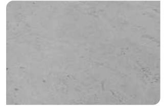
Bề mặt bê tông đạt