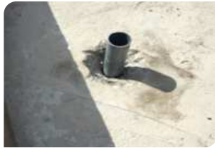
Đục vát quanh cổ ống, chèn xốp hoặc cốp pha bên dưới cổ ống