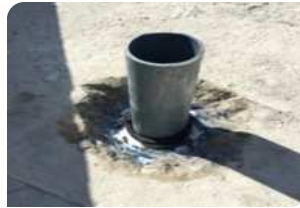
Vệ sinh cổ ống, quấn thanh trướng nở