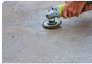
Sử dụng máy mài chà bề mặt bê tông