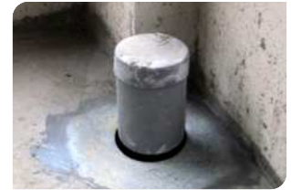
Bơm keo trám khe BS 8620S quanh cổ ống