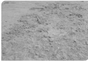
Bề mặt bê tông chưa đạt