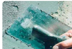
Trám và bề mặt bê tông bằng vữa sửa chữa Neorep