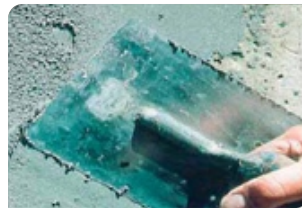
Trám vá bề mặt bê tông bằng vữa sửa chữa Neorep