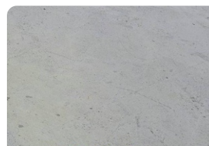
Bề mặt bê tông đạt