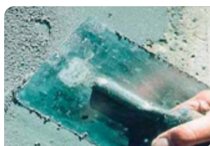
Trám vá bề mặt bê tông bằng vữa sửa chữa Neorep