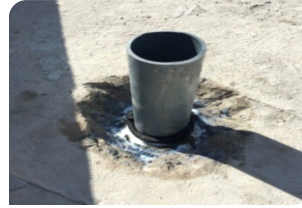
Vệ sinh cổ ống, quét thanh trường nở