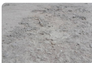
Bề mặt bê tông chưa đạt