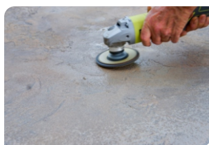
Sử dụng máy mài chà bề mặt bê tông