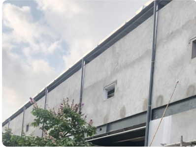
Bước 1: Vệ sinh bề mặt bê tông trước khi thi công