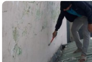
Đục tẩy lớp bong tróc