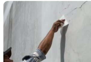
Trám vá bề mặt bê tông bằng vữa sửa chữa Neorep