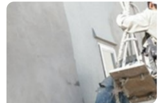
Bề mặt bê tông đạt