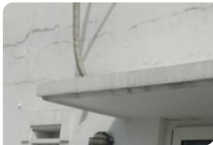
Bề mặt tường chưa đạt