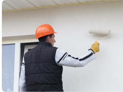
Bước 2: Quét lớp lót Revinex pha với nước (tỷ lệ 1:4)