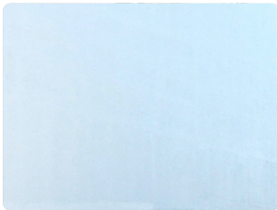
Bước 4: Thi công lớp phủ thứ 2 (nguyên chất), sau khi lớp 1 đã thi công được 24 giờ. Định mức: 0,14 kg/m 2