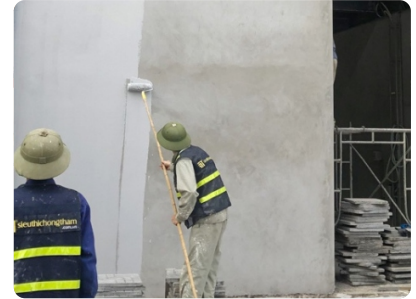
Bước 3: Thi công lớp phủ thứ 1 (pha 5% nước) sau khi lớp lót kết thúc 2 giờ. Định mức: 0,14 kg/m 2