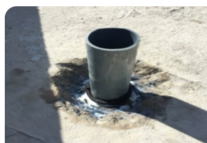
Vệ sinh cổ ống, quét thanh trướng nở