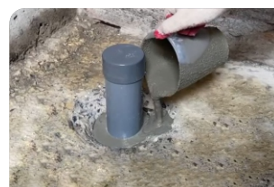
Thi công đổ vữa Lemax Grout LM-G650