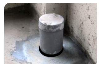
Bơm keo trám khe BS 8620S quanh cổ ống