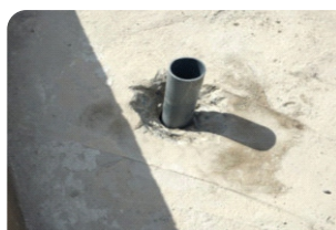
Đục vát quanh cổ ống, chèn xốp hoặc cốp pha bên dưới cổ ống