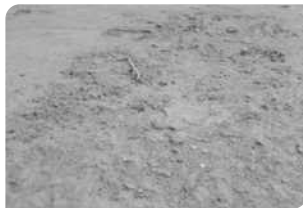
Bề mặt bê tông chưa đạt