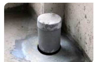
Bơm keo trám khe BS 8620S quanh cổ ống