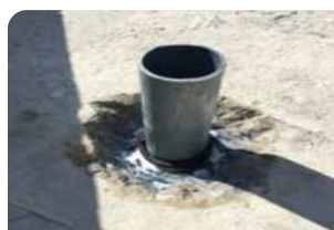
Vệ sinh cổ ống, quét thanh tương nở