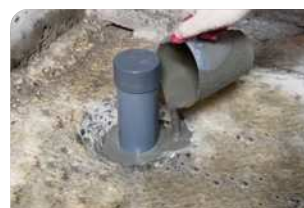
Thi công đổ vữa Lemax Grout LM-G650