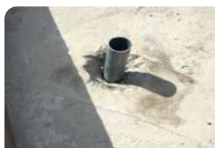
Đục vát quanh cổ ống, chèn xốp hoặc cốp pha bên dưới cổ ống