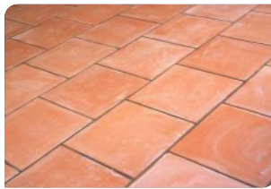
Vệ sinh bề mặt gạch