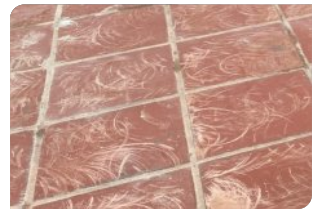
Bề mặt gạch đạt