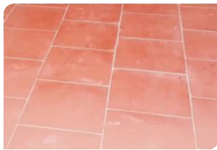
Bề mặt gạch chưa đạt