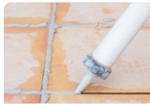
Keo trám khe BS 8620S