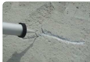
Keo trám khe Neotex® PU Joint