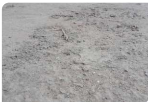
Bề mặt bê tông chưa đạt