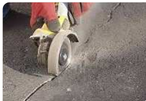
Cắt theo chiều dọc vết nứt