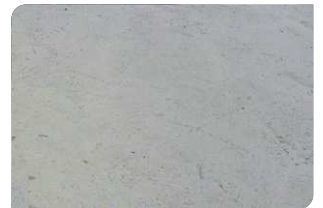
Bề mặt bê tông đạt