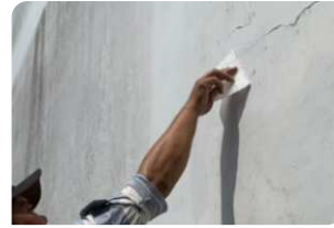
Dặm vá bằng Neorep Rapid