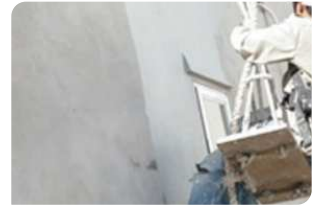
Bề mặt bê tông đạt