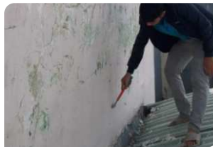
Đục tẩy lớp bong tróc