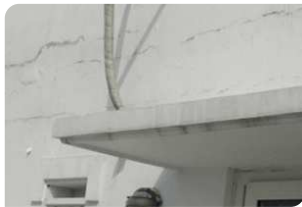
Bề mặt tường chưa đạt